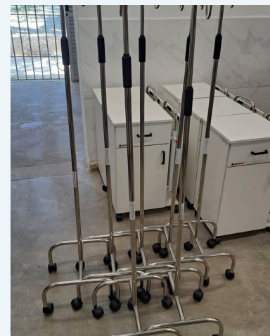
SUPORTE DE SORO