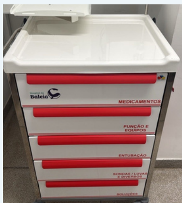
CARRINHO DE EMERGÊNCIA