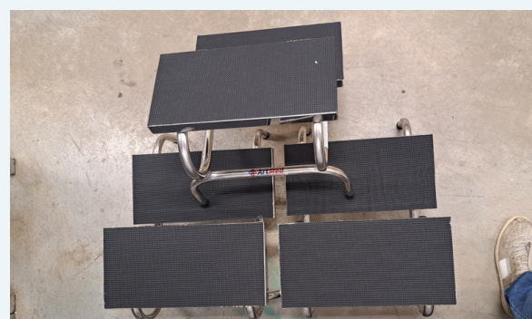
ESCALA DE DOIS DEGRAUS

Agradecemos a todos que contribuíram e fizeram parte deste movimento pela vida. Juntos, seguimos fortalecendo o cuidado e a esperança!