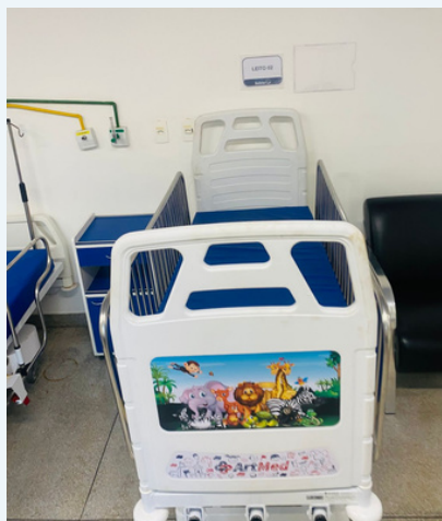
CAMA FOWLER TIPO BERÇO