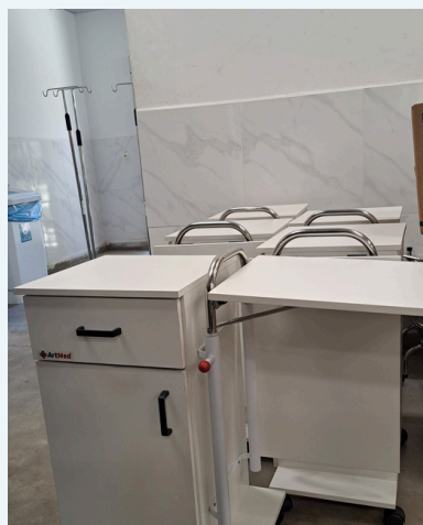
MESA DE CABECEIRA